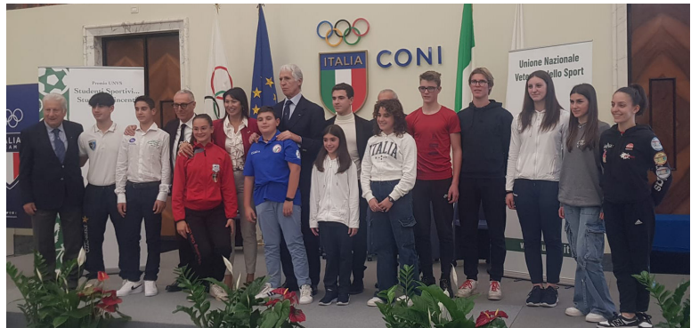
I premiati del concorso 2023 a Roma.

Altresì è prevista la possibilità di attribuire eventualmente il premio agli studenti "in transito" tra le scuole medie e scuole superiori. Con l'obiettivo di sostenere atleti-studenti che si siano maggiormente distinti per risultati agonistici di particolare rilievo abbinati a prestazioni scolastiche di eccellenza, saranno valutati i meriti scolastici, media voti e condotta disciplinare, ed i risultati raggiunti nella disciplina sportiva praticata, sia in ambito studentesco che federale (titoli conquistati a livello locale, provinciale, regionale, italiano ed oltre, convocazioni in rappresentative sia individuale che a squadre, vittorie in importanti manifestazioni etc.) nel corso dell'anno scolastico 2023/2024 comprendendo il periodo 15 settembre 2023 – 15 settembre 2024. Le candidature, corredate della relativa documentazione (come da scheda disponibile su sito www.unvs.it ), dovranno pervenire, entro e non oltre il 30 settembre 2024, alla Segreteria Generale U.N.V.S. tramite e-mail ( segreteria.unvs@libero.it ). L'attribuzione dei premi avverrà sulla base di un punteggio complessivo frutto della somma dei valori diversi attribuiti sia in ambito scolastico che sportivo con nuovi criteri approvati dal CDN. L'iscrizione al Concorso prevede l'automatica presenza del premiato/a a tale cerimonia. La consegna dei premi avverrà in occasione di un'apposita cerimonia organizzata entro il 2024 presumibilmente presso la Sede Nazionale del CONI a Roma.