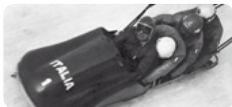
Quest'anno ricorre il 50° della medaglia d'oro olimpica