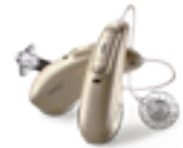
Phonak Audéo™ Marvel Amore al primo suono